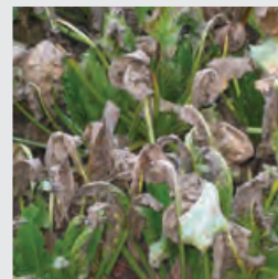
pjegavost lista šećerne repe