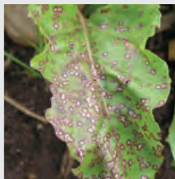
pjegavost lista šećerne repe

– u količini 0,2 – 0,3 l/ha. Dopuštene su tri primjene u vegetacijskoj sezoni u razmacima od 15 – 20 dana.