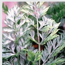
simptomi pepelnice na listu mrkve