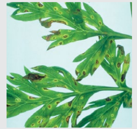
simptomi paleži na listu mrkve