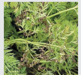
simptomi paleži na listu mrkve