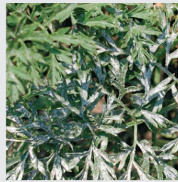
simptomi pepelnice na listu mrkve