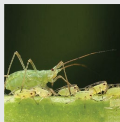
zelena graškova uš

Dopuštene su maksimalno dvije primjene tijekom vegetacije u razmaku od 14 dana.