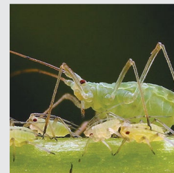
zelena lisna uš