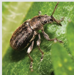
pipa mahunarka na listu graška